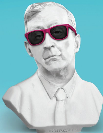
Cultuursponsorevent: HGO, Blik op Sjustakovitsj